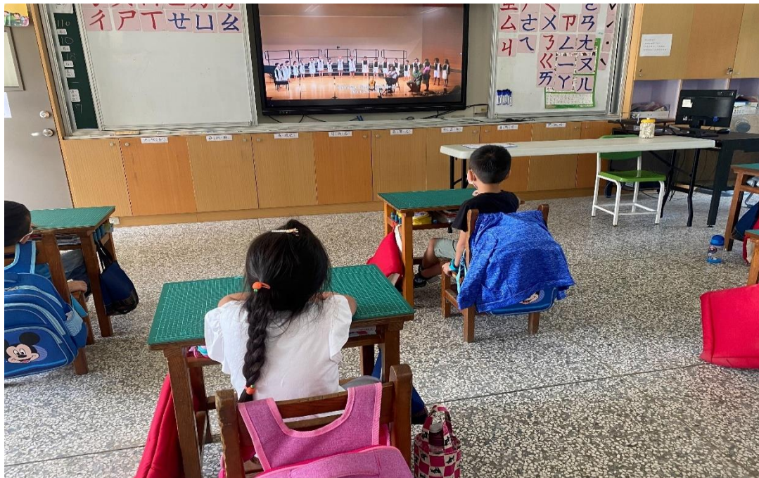
原住民語-欣賞西拉雅合唱團影片