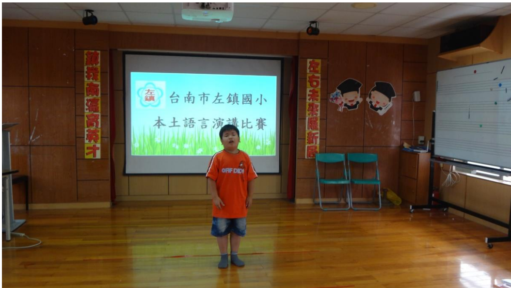
辦理本土語言演講比賽