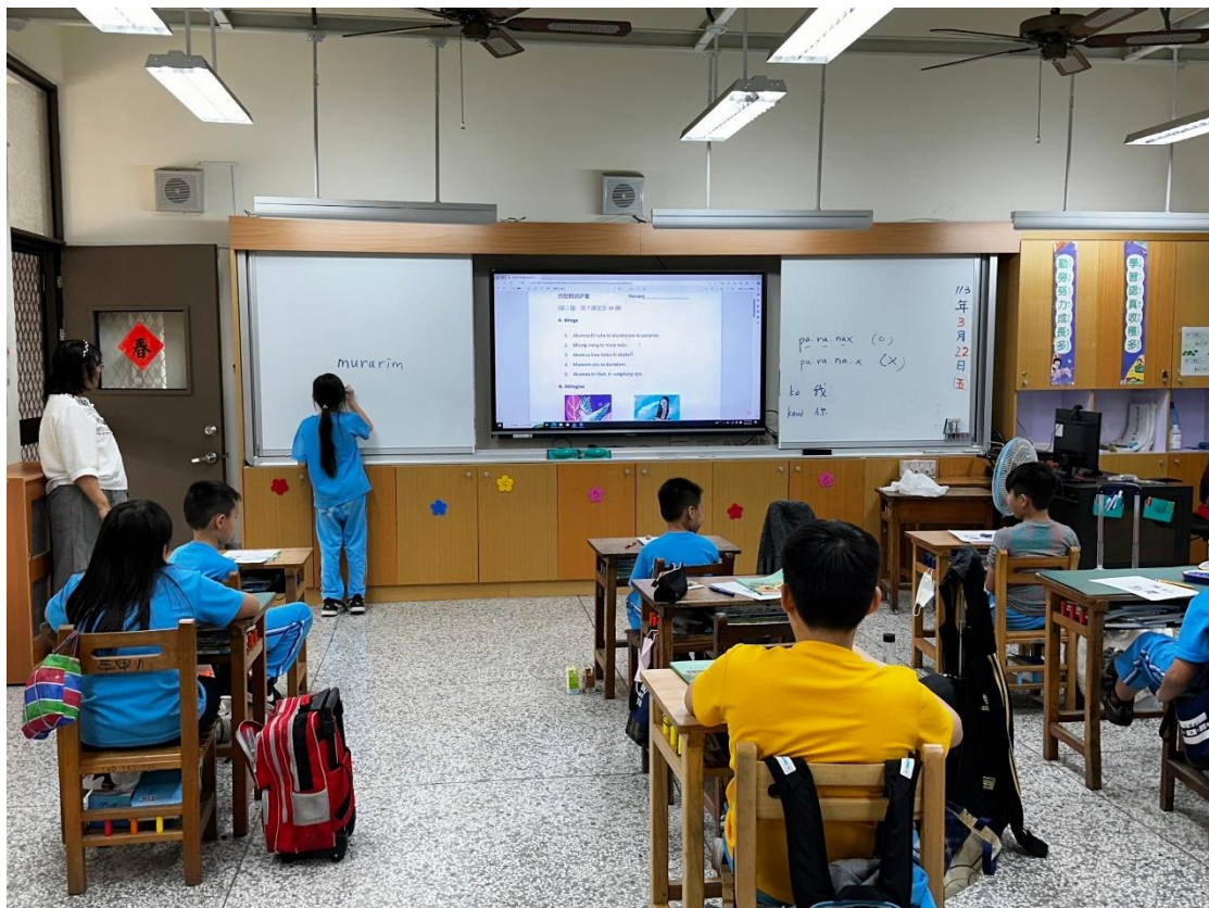
開設西拉雅語復育課程