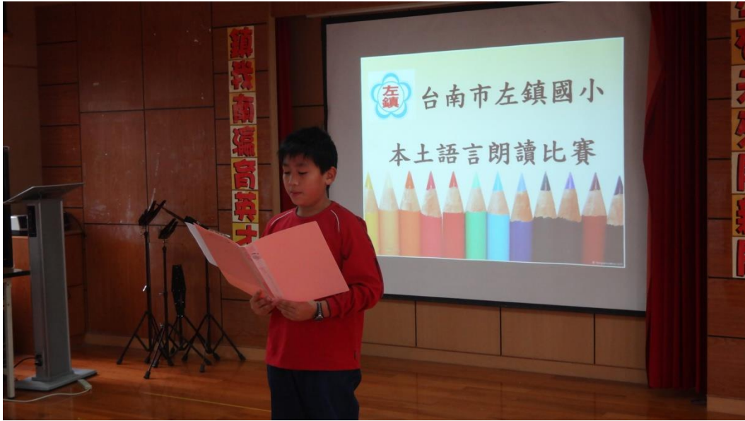
辦理本土語言朗讀比賽