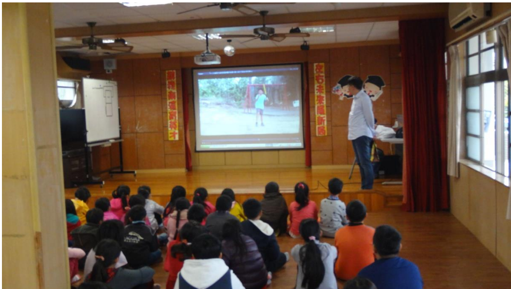
欣賞本土語言得獎微電影