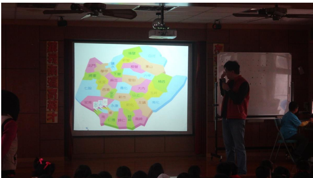
介紹家鄉的地理位置與方位