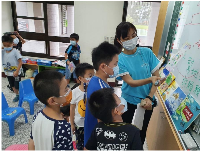
故事媽媽說閩南語故事