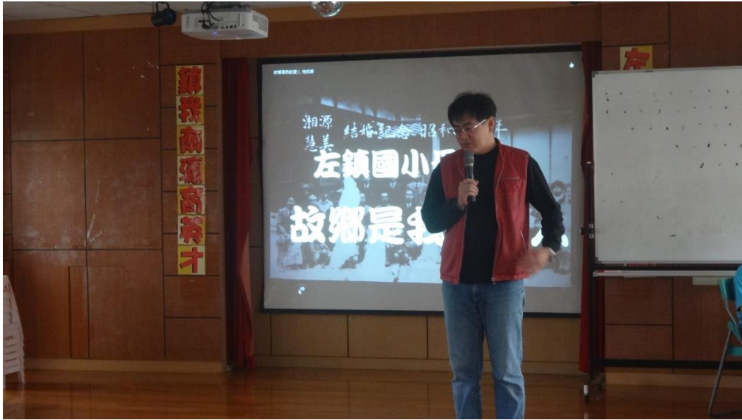
故鄉是我的愛人歌曲教學