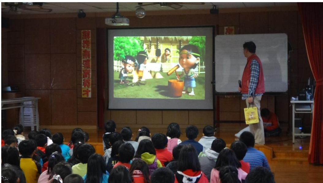
欣賞 西拉雅情人影片