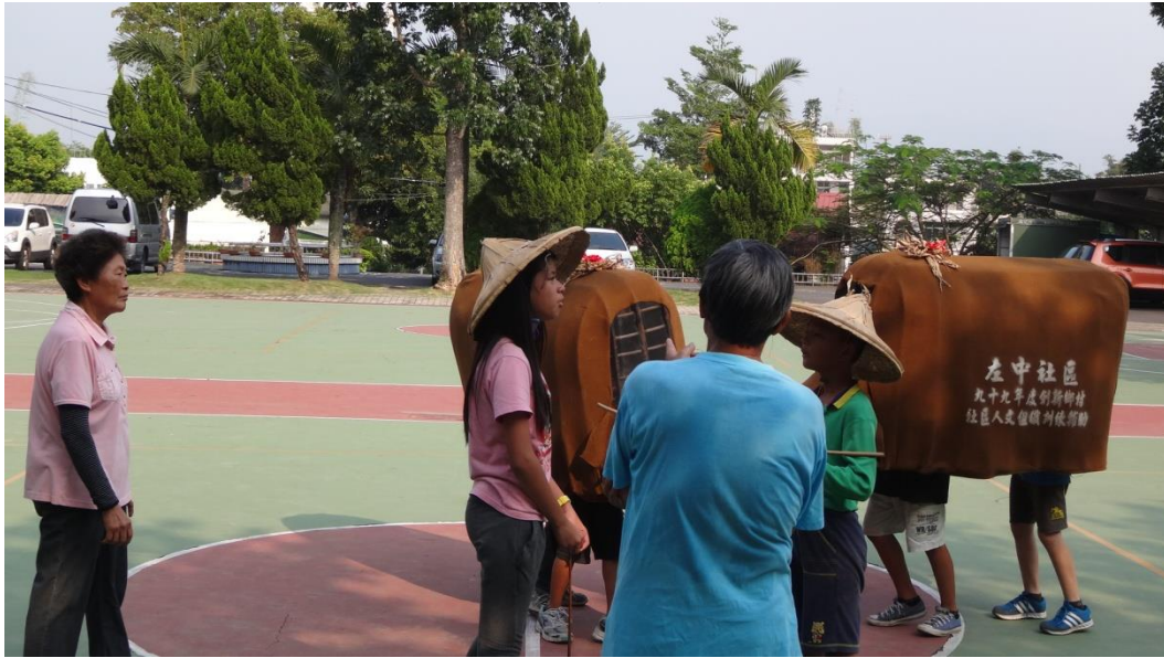
結合社區，傳承傳統鬥牛陣藝陣