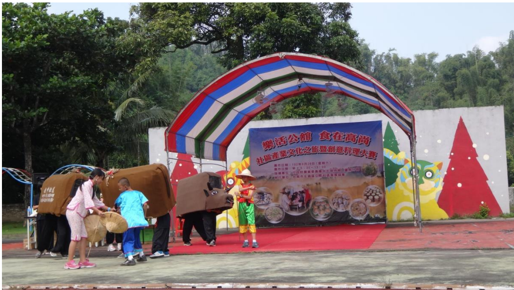
鬥牛陣參與公館社區樂活公館活動演出