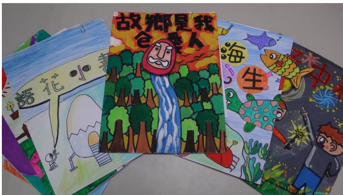
辦理魔法一頁書活動