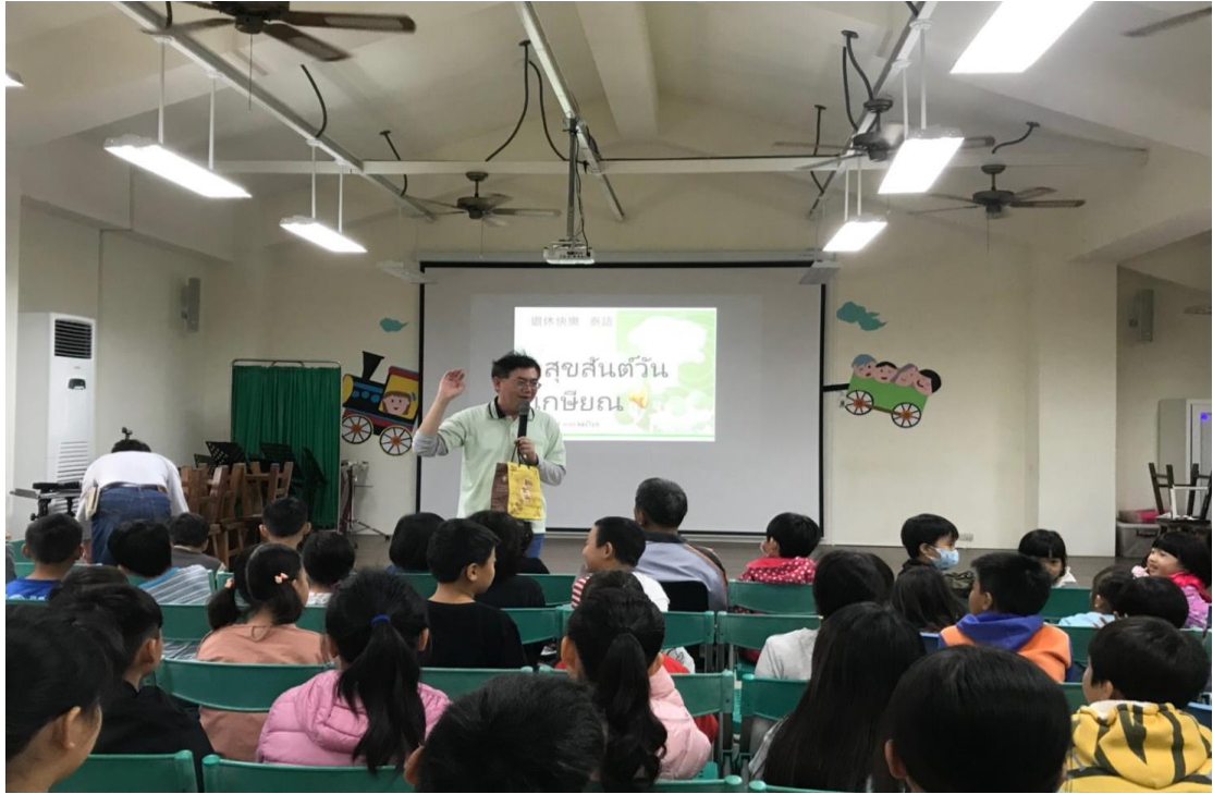
新住民語-泰語教學