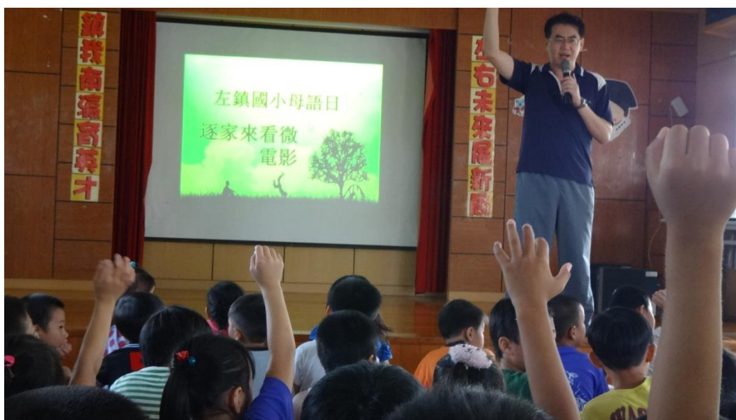
欣賞各校出品的微電影影片