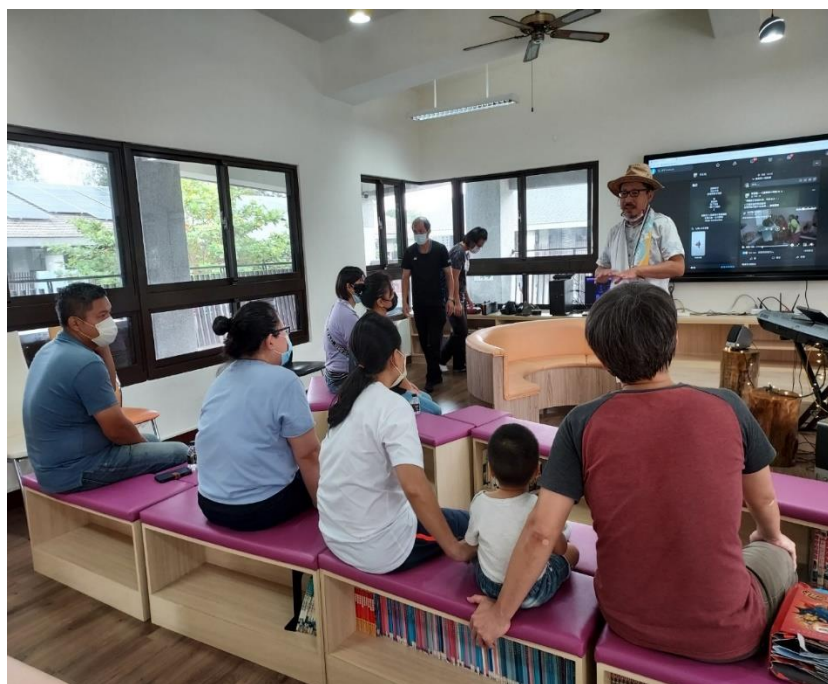
社區人士音樂分享