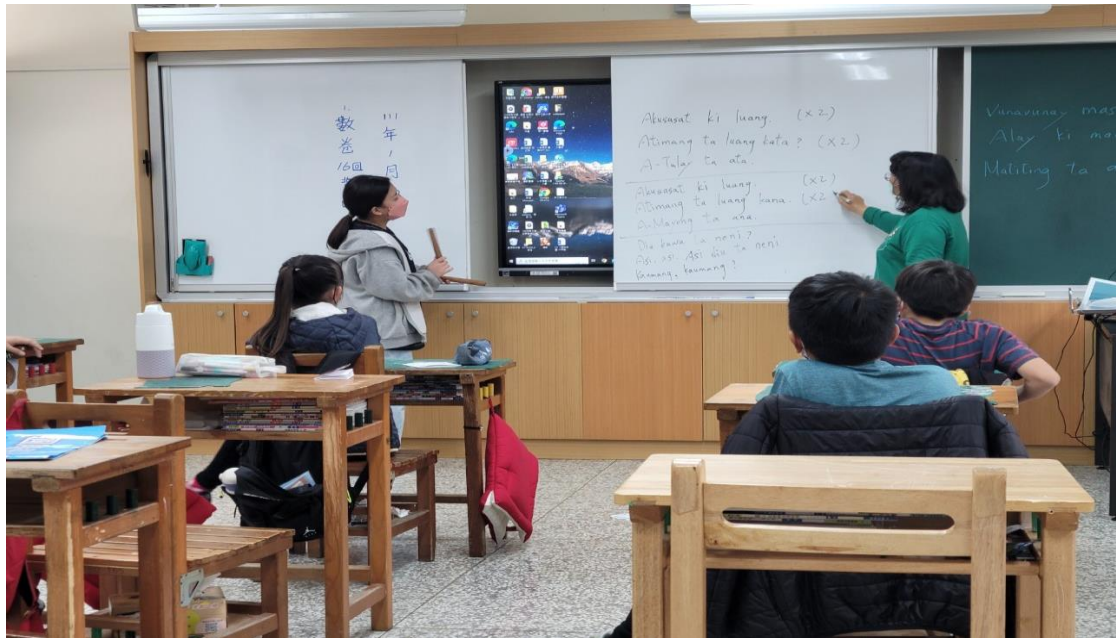
原住民語-西拉雅歌謠唱誦