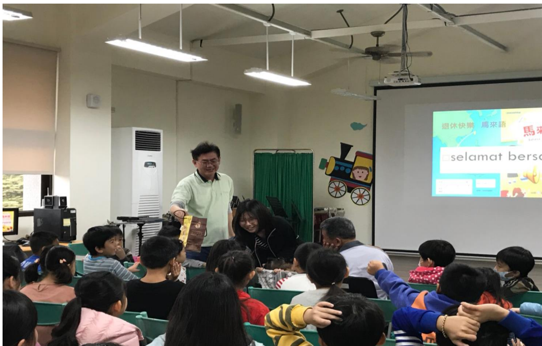
新住民語-馬來語教學