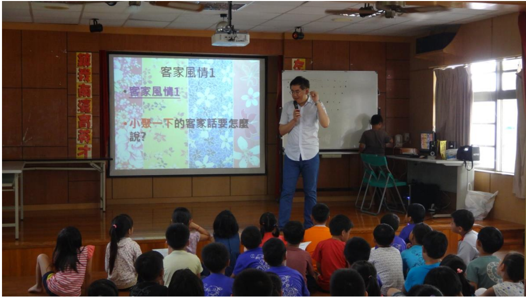
聽廣播 ICRT 學客語