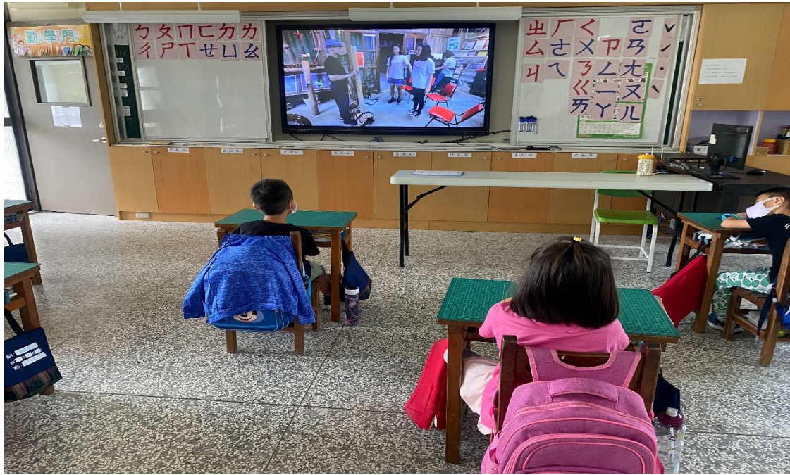
原住民語-西拉雅傳統樂器的介紹