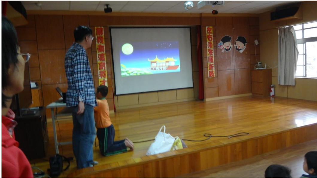
學唱客家歌曲-月光光