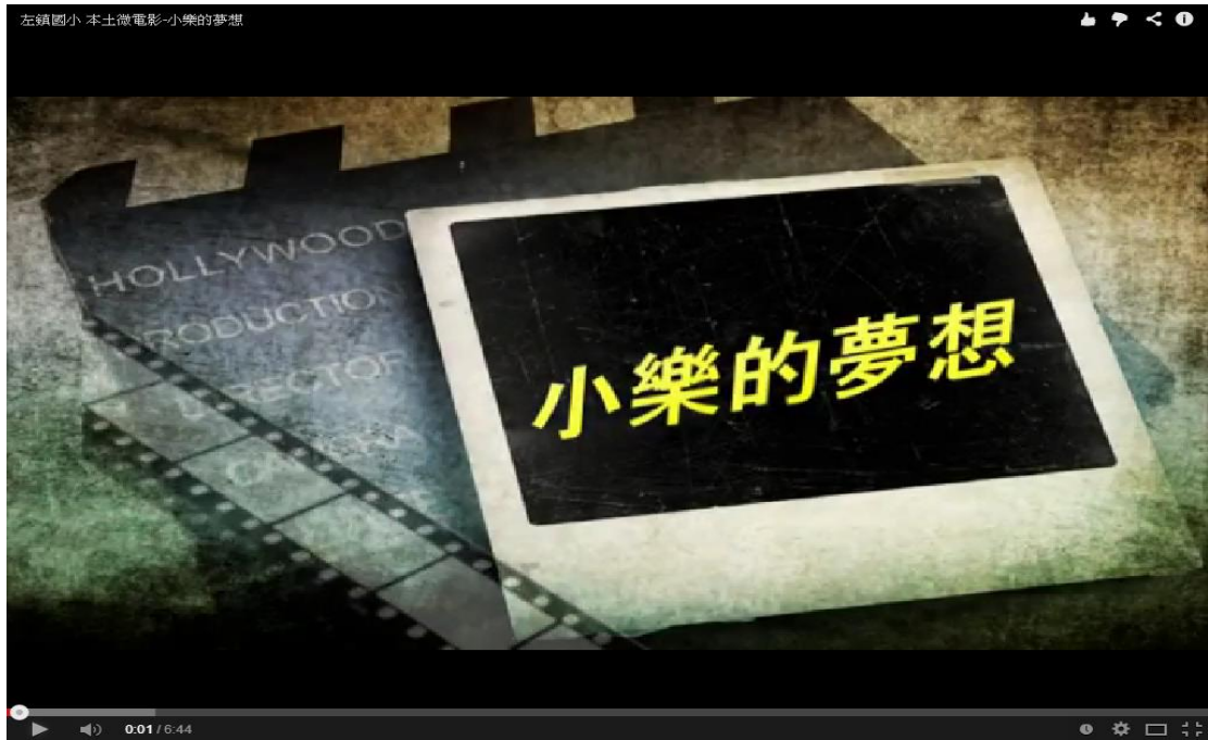
本土微電影-小樂的夢想