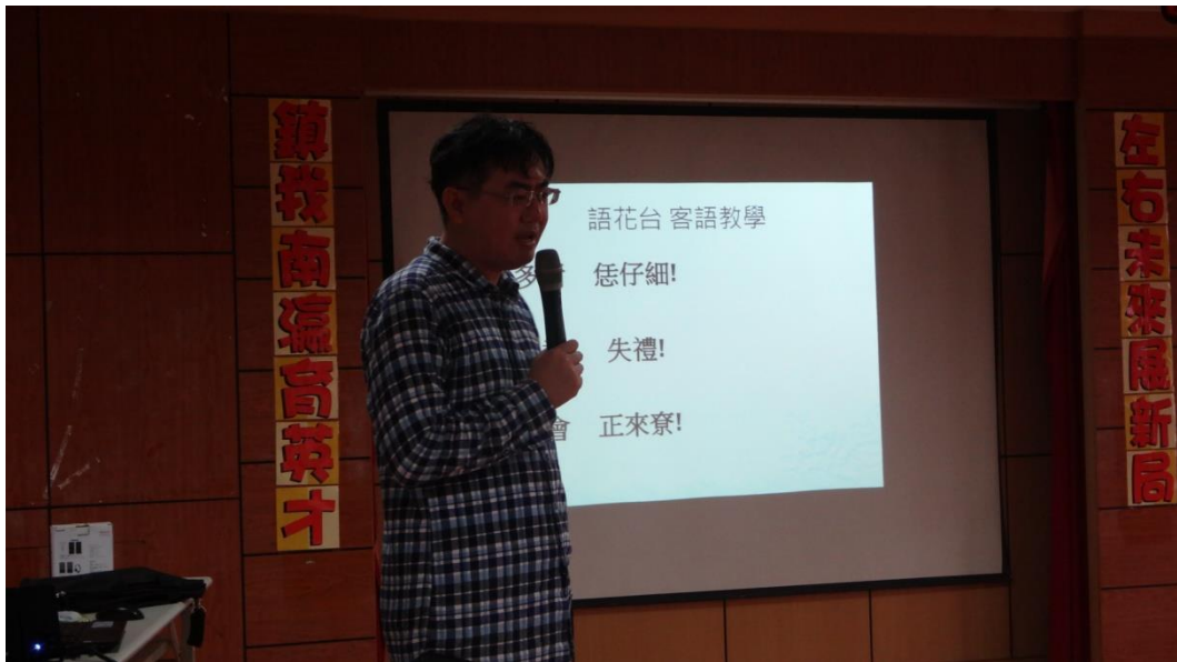
練習客家基本對話